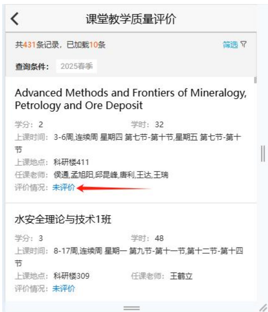
图6 课堂教学质量评价界面