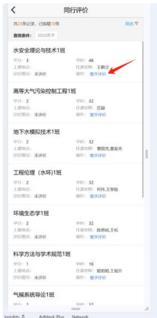
图7 同行专家评价课堂教学质量界面

点击【教学评价】填写同行评价评价表，点击【提交】提交评价，点击【保存】保存评价；