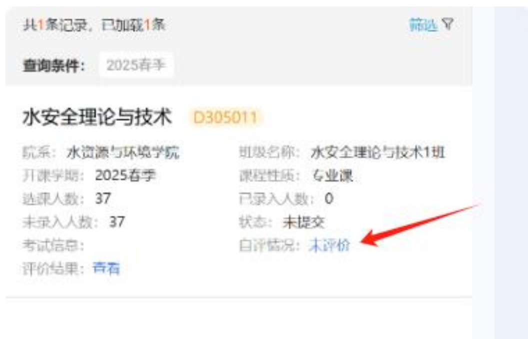
图 8 授课教师自评课堂教学质量界面

点击【自评情况：未评价】填写教师自评评价表，点击【提交】提交评价，点击【保存】保存评价。