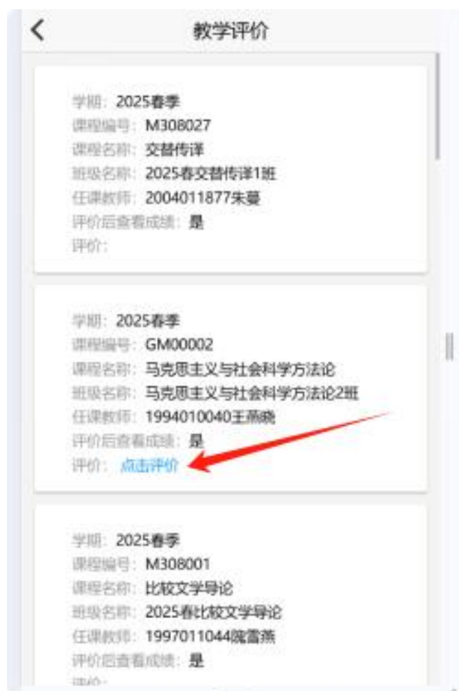
图9 学生评价课堂教学质量界面