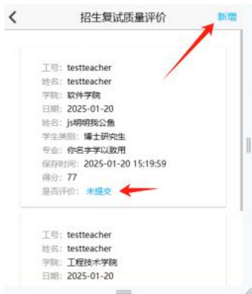
图2 招生复试质量评价界面