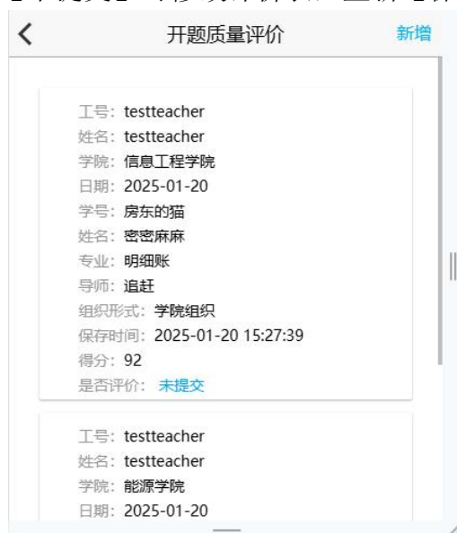
图3 学位论文开题质量评价界面